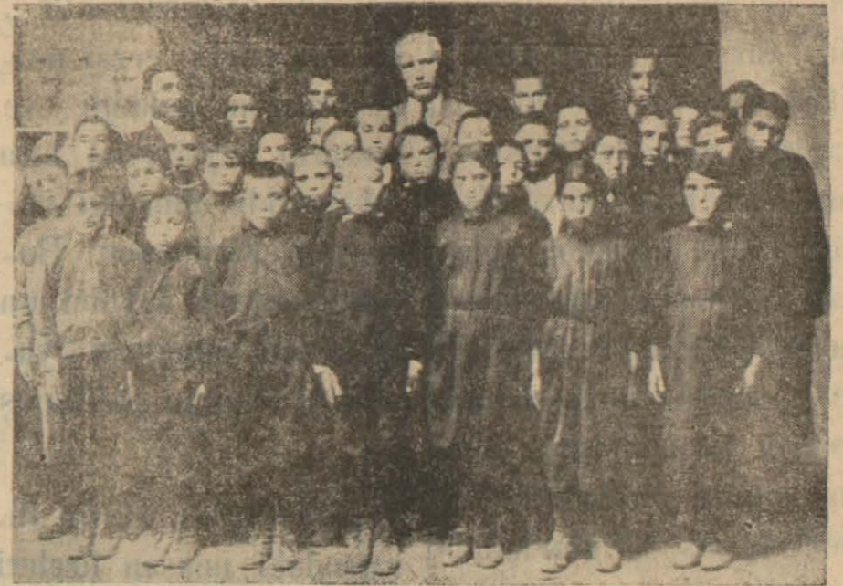
İşden Çıkıp Mektebe Giden Köy Çocukları

Çocuk Amele Okutulacak. Tedrisat Müdürlükleri Birleştirilecek