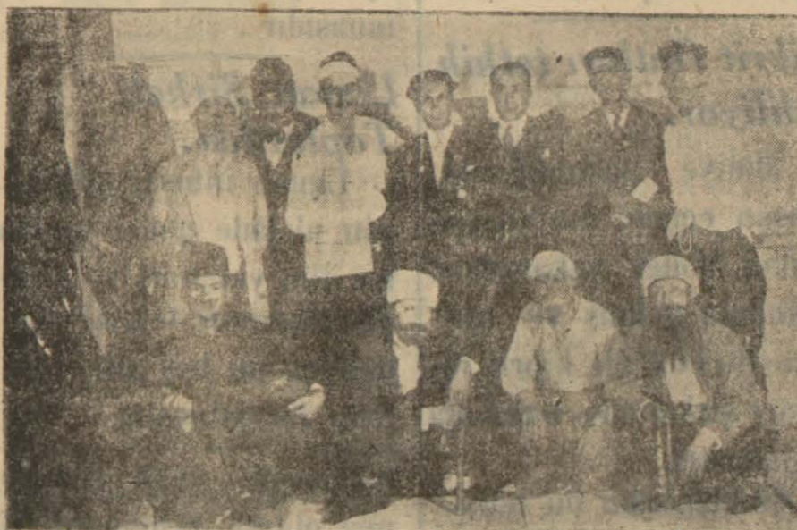
Halkevi Temsil Komitesi Temsilden Sonra

Yarın bir temsil ve konser verilecek. Yıllık çalışmanın verimi anlatılacak.